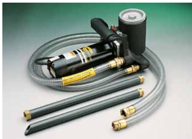
Портативная система фильтрации Guardian®